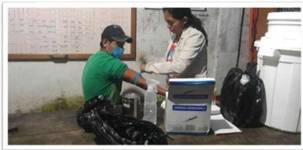
Jornadas de exámenes de colinesterasa.

En caso de emergencia, se tienen botiquines móviles para prestar primeros auxilios a los colaboradores operativos y administrativos dentro de la empresa. En el programa de salud y seguridad ocupacional de los colaboradores con frecuencia semestral, se programaron exámenes de colinesterasa y creatinina dos veces al año mayo y noviembre beneficiando a 106 trabajadores, para la prevención y detección de valores fuera del rango normal y poder prevenir el desarrollo de alguna enfermedad ocupacional en cada colaborador que tiene contacto con productos agroquímicos.