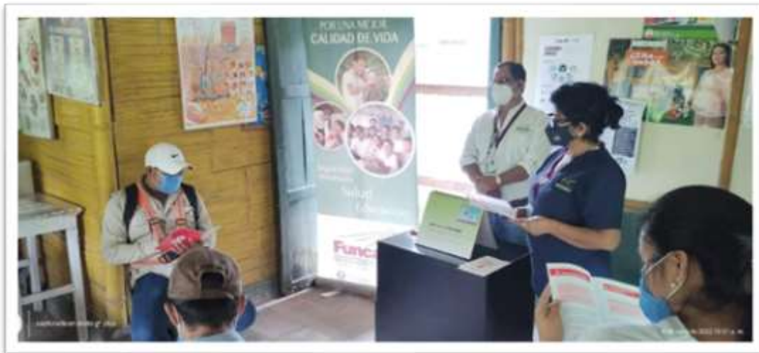
Jornada de prevención y sensibilización del VIH/SIDA

Programa de salud y seguridad ocupacional: se ha contribuido a la salud integral de los colaboradores y la de sus familias, se registra que, en el año 2022, se brindó más 1058 consultas a colaboradores de la empresa y familias que fueron atendidas en clínica médica empresarial. Además, se realizaron dos jornadas de desparasitación a los colaboradores, jornadas de tamizaje de pruebas rápidas de VIH (voluntario) a 49 personas y capacitando a 93, Jornadas de búsqueda activa de casos positivos de COVID-19 realizada por la brigada empresarial del Instituto guatemalteco de seguridad social (IGSS) realizado a 197 personas, jornadas oftalmológicas a 78 personas y jornadas de ultrasonidos de órganos internos (USG) beneficiando a 18 colaboradores con el apoyo de FUNCAFE.