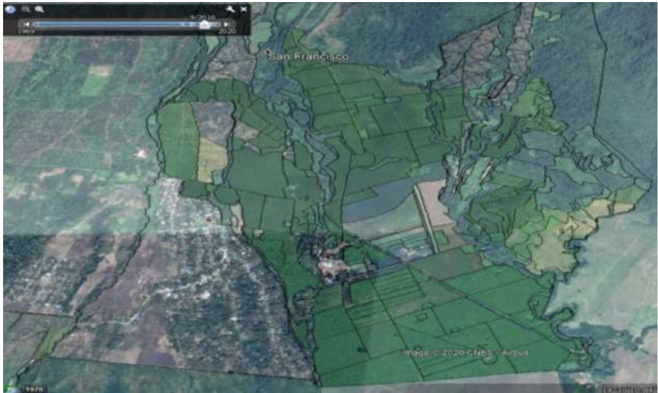
Uso de suelo Finca Panamá, año 2016, áreas cultivadas con hule.