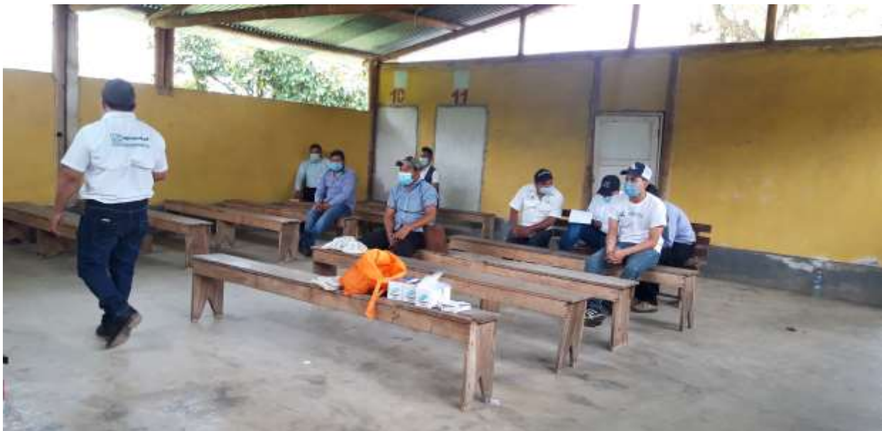
Jornadas de desparasitación.

En caso de emergencia, se tienen botiquines móviles para prestar primeros auxilios a los colaboradores operativos y administrativos dentro de la empresa. En el programa de salud y seguridad ocupacional de los colaboradores con frecuencia semestral, se les realizó análisis de laboratorio de colinesterasa y creatinina para prevención y detección de valores fuera del rango normal y poder prevenir el desarrollo de alguna enfermedad ocupacional en cada colaborador que tiene contacto con productos agroquímicos.