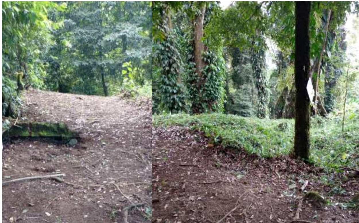
Barrera cortafuegos y recorrido mensual de guardabosque para protección AVC-I.

Las medidas de protección para contrarrestar las amenazas a la permanencia de los AVCs implementados ayudó a conservar, mantenerlos y resguardarlos, por lo que las actividades ejecutadas fueron efectivas.