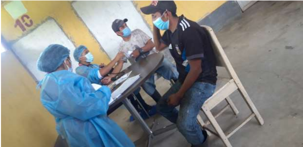
Jornadas de hisopados

Programa de salud y seguridad ocupacional: se ha contribuido a la salud integral de los colaboradores y la de sus familias, se registra que, en el año 2021, se brindó más 849 consultas a colaboradores de la empresa y familias que fueron atendidas en clínica médica empresarial. Además, se realizaron dos jornadas de desparasitación a los colaboradores, jornadas de tamizaje de pruebas rápidas de VIH (voluntario), Jornadas de búsqueda activa de casos positivos de COVID-19 realizada por la brigada empresarial del Instituto guatemalteco de seguridad social (IGSS) realizado a 326 personas, jornadas oftalmológicas a 116 personas y jornadas de ultrasonidos de órganos internos (USG) beneficiando a 36 colaboradores con el apoyo de FUNCAFE.