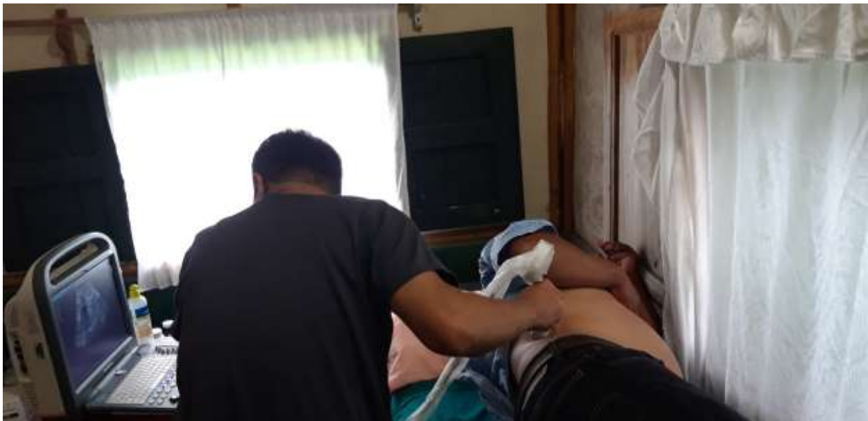
Jornadas de Ultrasonidos de órganos internos.